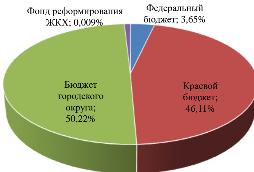
Рисунок 1 «Объем бюджетных ассигнований в разрезе источников финансирования, тыс. рублей»

Общий объем бюджетных ассигнований на реализацию мероприятий муниципальных программ утвержден в сумме 15 205 369,38 тыс. рублей, в том числе: средства федерального бюджета – 556 183,9 тыс. рублей, краевого бюджета – 7 011 137,70 тыс. рублей, бюджета городского округа – 7 636 561,32 тыс. рублей.