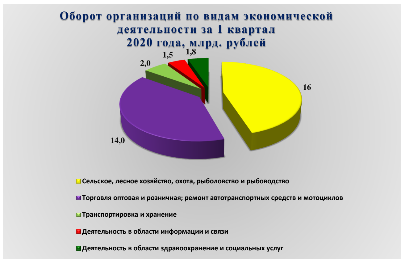
Рис. 1. Оборот организаций по видам экономической деятельности за 1 квартал 2020 года, млрд. рублей

В январе - марте 2020 года оборот организаций Петропавловск-Камчатского городского округа по всем видам экономической деятельности в действующих ценах составил 47 057,50 млн. рублей, что на 30 % выше уровня предыдущего года. Из общего объема оборота организаций на долю организаций сельского, лесного хозяйства, охоты, рыболовства и рыбоводства приходится 34 %; на долю организаций оптовой и розничной торговли, ремонта автотранспортных средств и мотоциклов – 29,7 %; на организации обрабатывающих производств – 12,8 %.