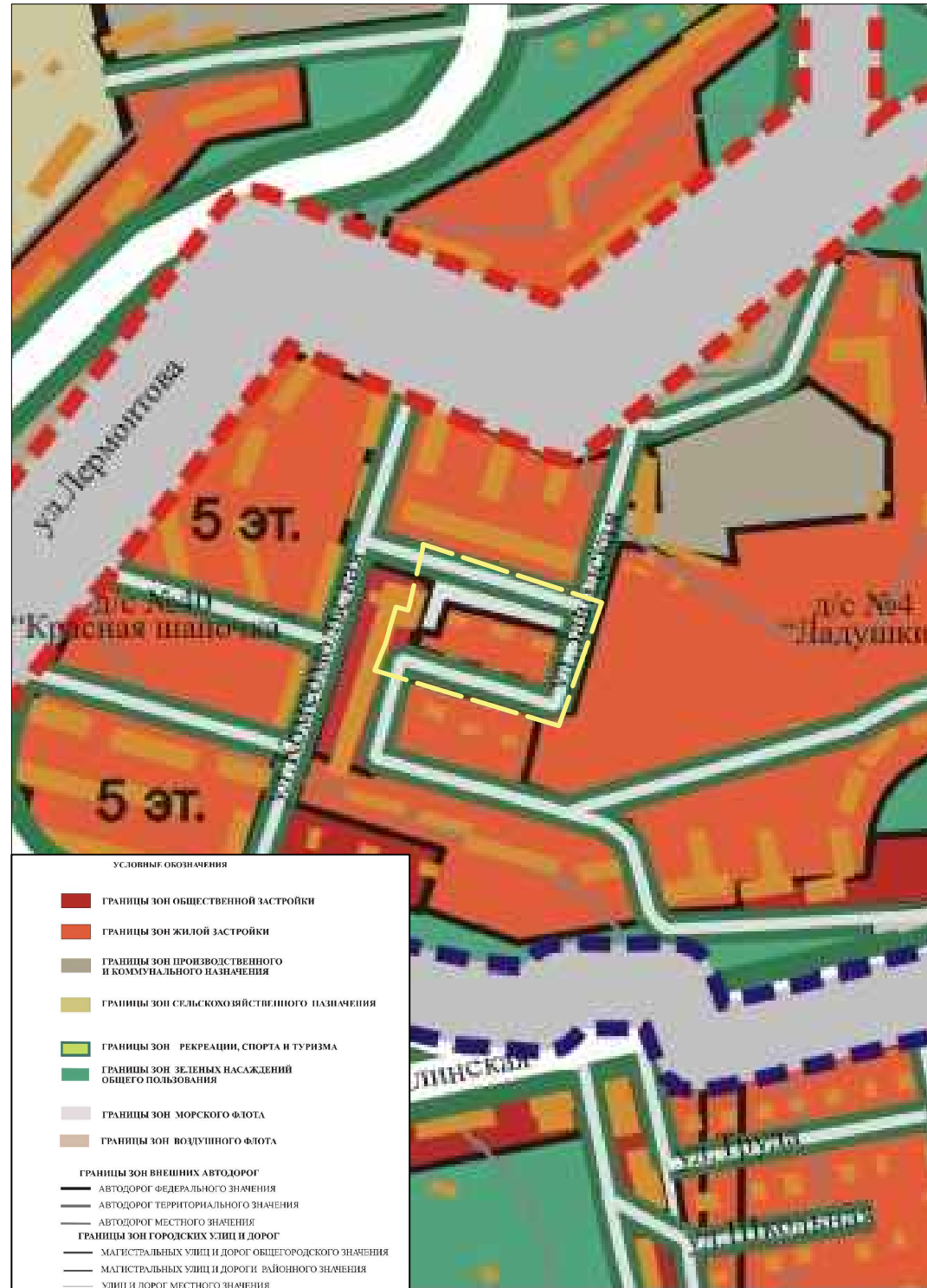
Фрагмент схемы функционального зонирования