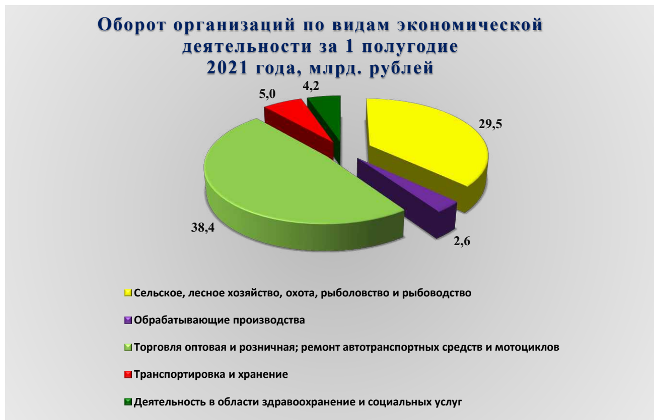
Рис. 1. Оборот организаций по видам экономической деятельности за 1 полугодие 2021 года, млрд. рублей

В январе - июне 2021 года оборот организаций Петропавловск-Камчатского городского округа по всем видам экономической деятельности в действующих ценах составил 94 457,4 млн. рублей, что в действующих ценах на 1,0 % выше уровня аналогичного периода предыдущего года. Из общего объема оборота организаций на долю организаций оптовой и розничной торговли, ремонта автотранспортных средств и мотоциклов приходится 40,7 %, на организации сельского, лесного хозяйства, охоты, рыболовства и рыбоводства – 31,3 %, на организации транспортировки и хранения – 5,2 %, на организации, осуществляющие деятельность в области здравоохранения и социальных услуг – 4,5 %, на организации обрабатывающих производств – 2,7 %.