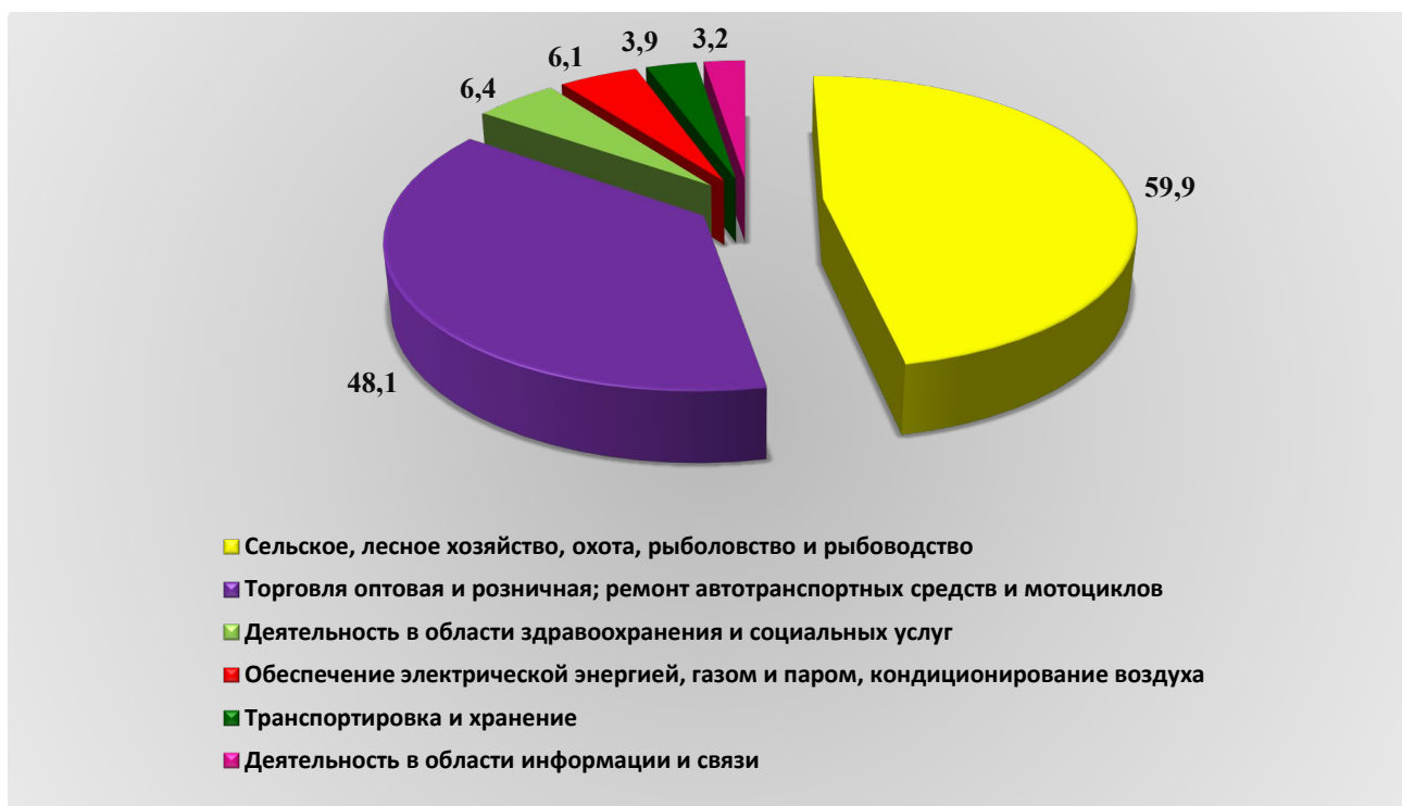
Рис. 1. Оборот организаций по видам экономической деятельности за январь – июнь 2024 года, млрд. рублей

Оборот организаций по видам экономической деятельности за январь – июнь 2024 года представлен на рисунке (далее – рис.) 1.