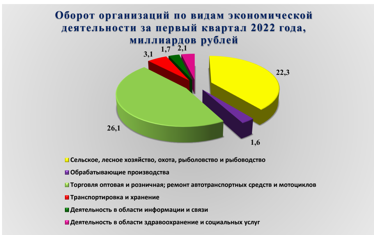
Рис. 1. Оборот организаций по видам экономической деятельности за первый квартал 2022 года, млрд. рублей

В январе – марте 2022 года оборот организаций городского округа по всем видам экономической деятельности в действующих ценах составил 68 277,800 миллиона (далее – млн.) рублей, что в 1,6 раза выше уровня аналогичного периода предыдущего года. Из общего объема оборота организаций на долю организаций оптовой и розничной торговли, ремонта автотранспортных средств и мотоциклов приходится 38,3 %, на долю организаций сельского, лесного хозяйства, охоты, рыболовства и рыбоводства приходится 32,7 %, на долю строительства – 9,1%, по 4,5 % – на долю организаций, занимающихся обеспечением электроэнергией, газом и паром, и транспортировкой и хранением.