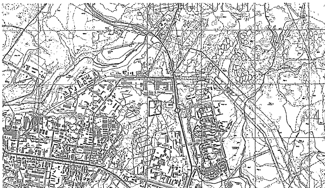
Рис. 1. Размещение проектируемой территории в границах города

Территория, в отношении которой подготовлен Проект межевания расположена в северной части г. Петропавловска-Камчатского, в районе ул. Производственная, проспект Содружества. Площадь территории в границах проекта межевания – 5,65 га.