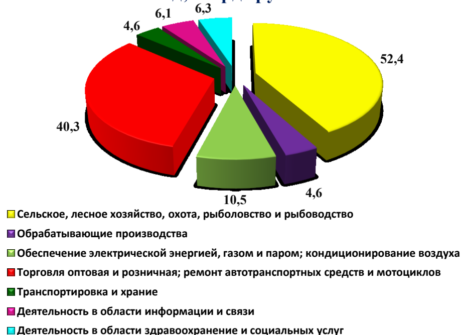
Рис. 1. Оборот организаций по видам экономической деятельности за 2018 год, млрд. рублей

Сокращение оборота по сравнению с 2017 годом, имело место в следующих видах деятельности: