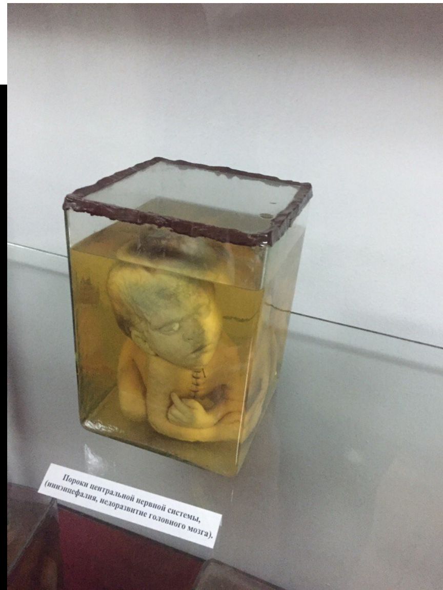
Пороки центральной нервной системы, (миэлинефалия, недоразвитие головного мозга).